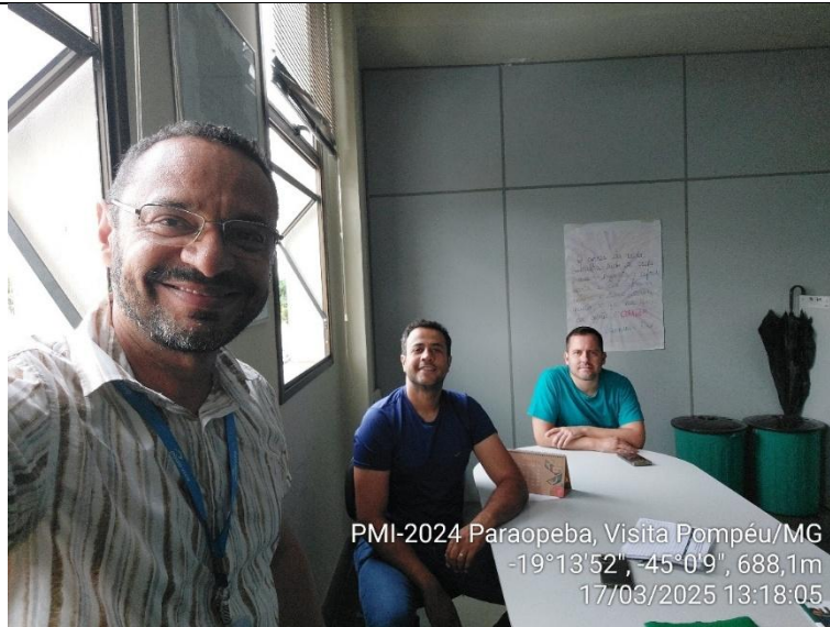
PMI-2024 Paraopeba, Visita Pompéu/MG -19°13'52", -45°0'9", 688,1m 17/03/2025 13:18:05