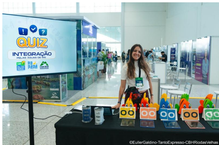
Copos sendo distribuídos após dinâmica no estande do CBH Paraopeba