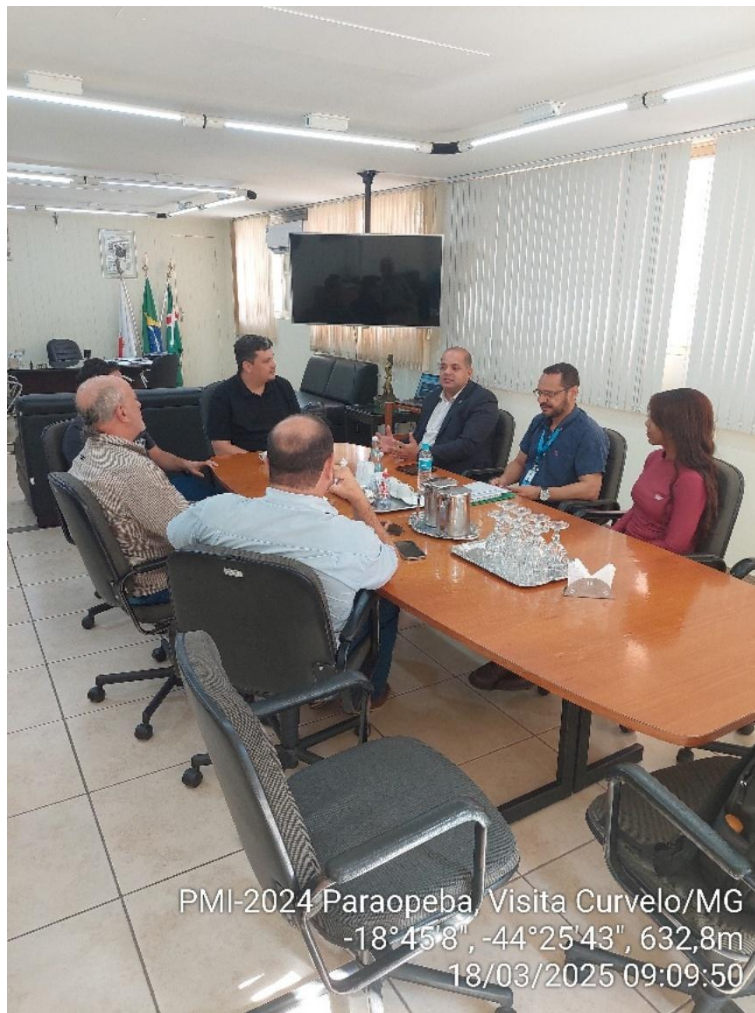
PMI-2024 Paraopeba, Visita Curvelo/MG -18°45'8", -44°25'43", 632,8m 18/03/2025 09:09:50